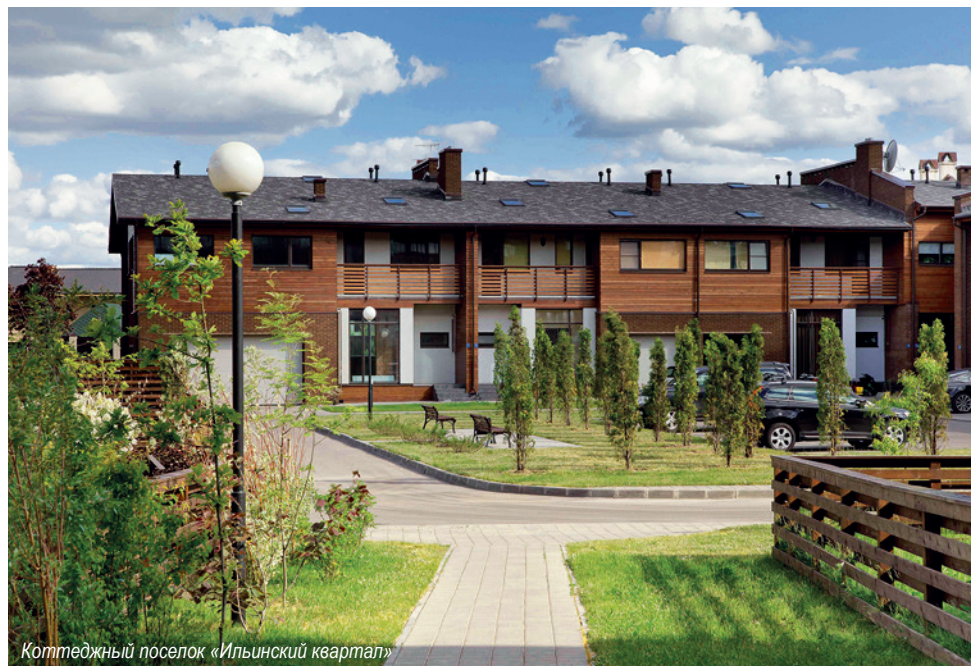
Коттеджный поселок «Ильинский квартал»

«Ильинский квартал», «Резиденция Рублево», Park Avenue, Victoria City, «Фирсановка Лайф».