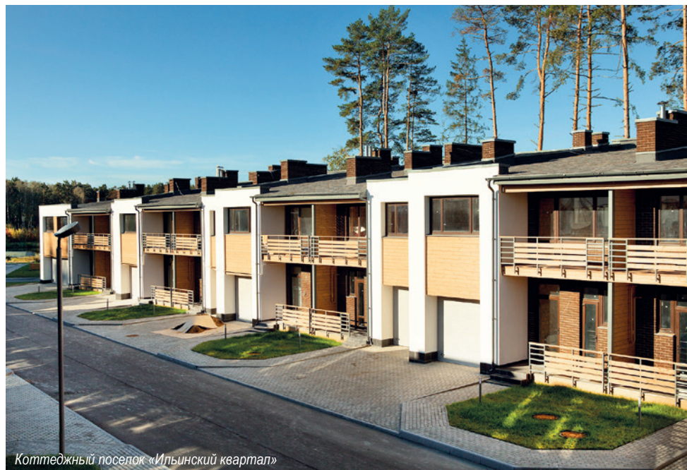
Коттеджный поселок «Ильинский квартал»

Инженерные коммуникации должны быть выполнены из современных материалов: электрические провода — желательно медные, водопроводные трубы — полиэтилен низкого давления (ПНД) или оцинковка.