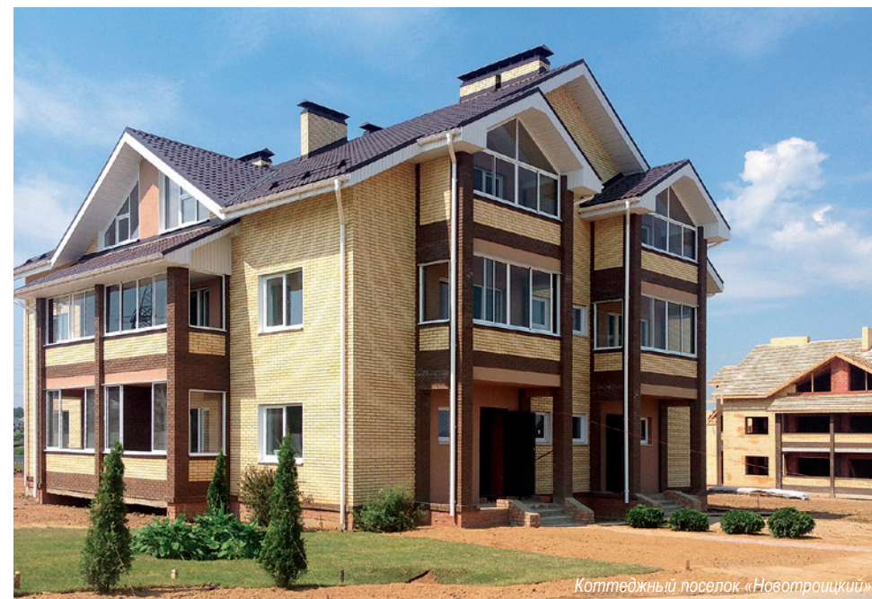
Коттеджный поселок «Новотроицкий»

Пеноблоки изготавливают из смеси воды, цемента и песка с пенообразователем. Они дешевле газосиликатных блоков, хотя уступает им по многим другим характеристикам. Другой эконом-материал — керамзитобетонные блоки. Их делают из бетона со вспученной глиной в качестве заполнителя. Большой недостаток керамзитобетона — гигроскопичность и низкая прочность.