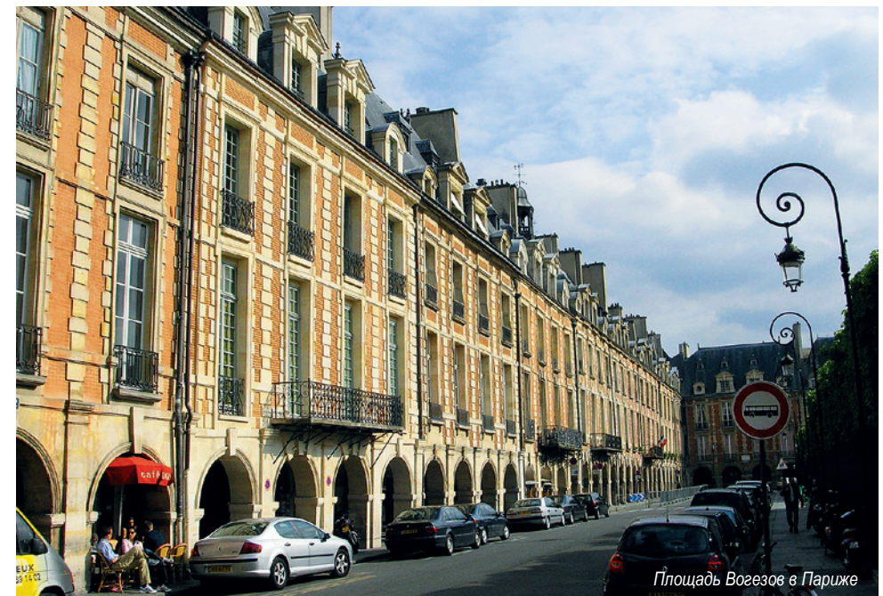
Площадь Вогезов в Париже

Что же это такое на самом деле, и в каких случаях применение этого градостроительного термина будет считаться легитимным?