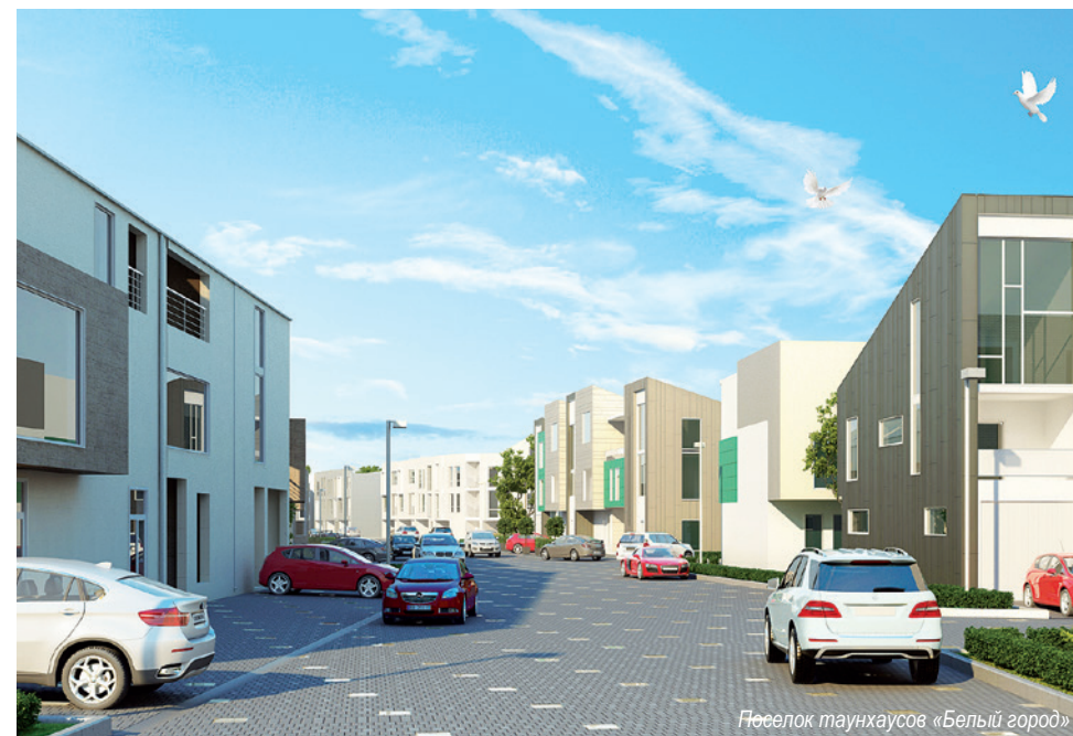
Поселок таунхаусов «Белый город»

А вот какие данные приводит отдел продаж поселка «Маленькая Шотландия»: в целом на рынке проектов эконом-класса 60 % таунхаусов строится из ячеистого бетона (блоков), 30 % из кирпича.