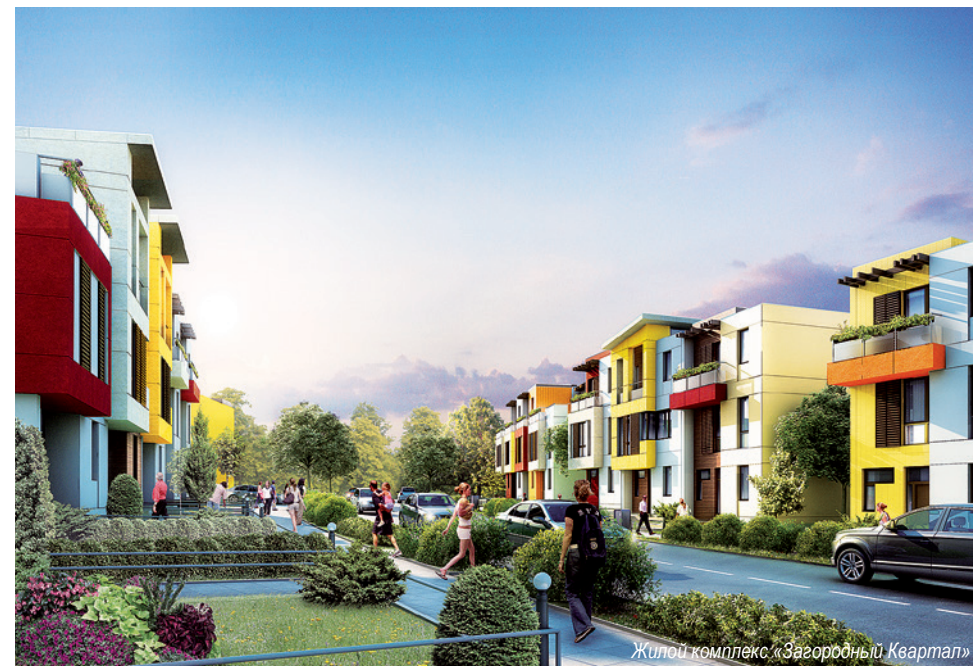
Жилой комплекс «Загородный Квартал»