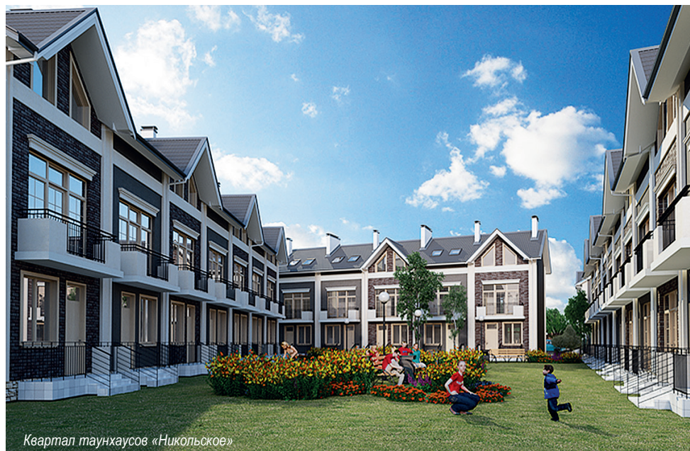
Квартал таунхаусов «Никольское»

Также нужно учитывать, что у таких домов часто нужно сделать отмостку, которая становится частью общего имущества, к которому у каждого должен быть доступ. В результате возникают неразрешимые проблемы — как обеспечить такой доступ, как огородить участок, потому что внутри оказывается общая собственность. Если таунхаус оформлен как жилой дом, то в этом случае образуется единый земельный участок, как находящийся под пятном застройки данного блока, так и на прилегающей территории. В этом случае возникают два документа — документ на собственность на дом и документ на собственность на земельный участок.