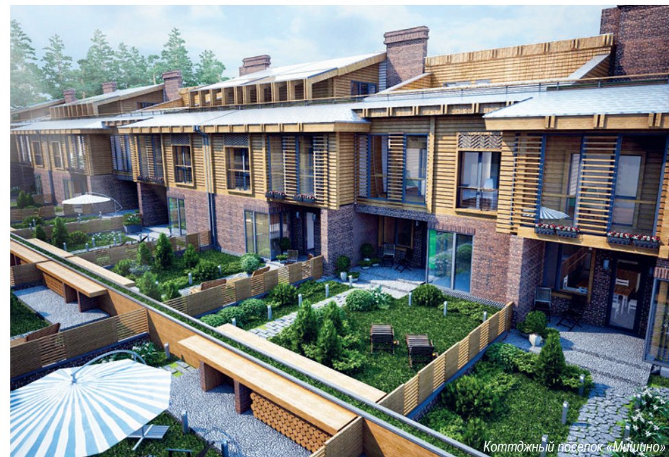
Коттеджный поселок «Митино»