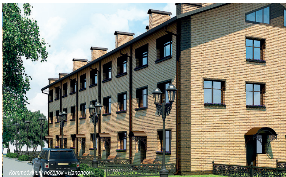
Коттеджный поселок «Наполеон»

С «модой» на новые названия иногда связаны забавные ситуации. Иногда покупатели из России, например, просят зарубежных риэлторов показать им «не надоевшие таунхаусы, а настоящие лейнхаусы» (сленговое английское название того же таунхауса). Такой экзамен на «профпригодность» риэлторы проходят по разному: кто-то пытается выяснить в чем же там отличие, а наиболее бойкие, не задавая лишних вопросов, приглашают «продвинутых» покупателей осмотреть «самый лучший комплекс лейнхаусов».