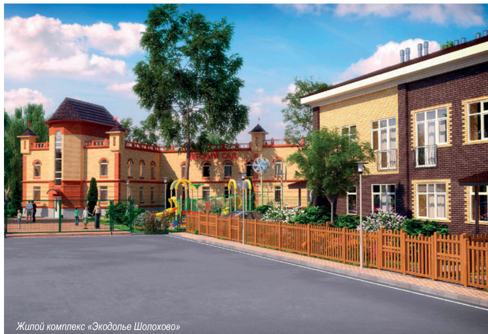
Жилой комплекс «Экодолье Шолохово»

Собственники должны собрать общее собрание и выбрать один из способов управления, например, привлечь стороннюю организацию. Чаще всего таунхаусов эта проблема не касается, потому что в них порядка 10 блоков. А до 12 квартир допускается управление без привлечения каких-то управляющих организаций. Но все формальности при этом нужно соблюсти — провести собрание, избрать председателя. В противном случае муниципальное образование, где расположен этот таунхаус, обнаружит, что эти мероприятия не проведены, не выбран способ управления, и организует привлечение управляющей организации.