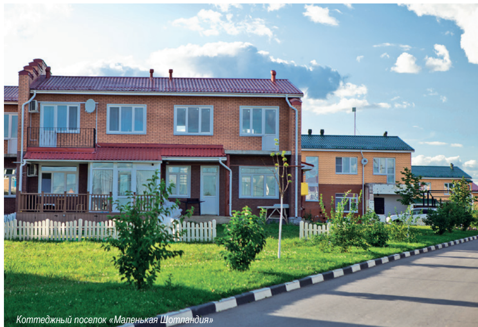
Коттеджный поселок «Маленькая Шотландия»

Одной из причин, снижающих ценность коттеджей, построенных в конце прошлого века, является отсутствие проектной документации с указанием технологии строительства и использованных материалов. Без этой информации невозможно грамотно обслуживать дом!